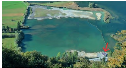
Die neue Beobachtungsplattform am Fuss der Aufschütta

Der bauliche Unterhalt wie Reparatur- und Instandhaltungsarbeiten sowie Umgebungsarbeiten führt der Kanton Obwalden aus. Hingegen liegt der betriebliche Unterhalt wie monatliche Reinigung des Innenraums, das wöchentliche Einsammeln und deren Entsorgung von Abfall sowie die Sicherstellung der gefahrenlosen Zugänglichkeit bei der Gemeinde. Diese Arbeiten werden durch den Werkdienst Alpnach ausgeführt. Besuchende erreichen die Beobachtungsplattform zu Fuss.