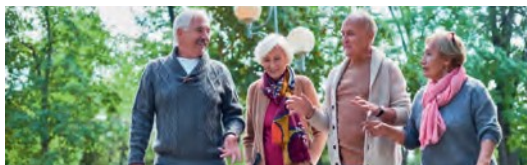
Gemeinsam unterwegs sein macht Freude

Sicherheits- und Sozialdepartement SSD Gesundheitsamt