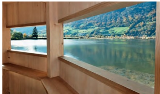
Aussicht aus der Beobachtungsplattform