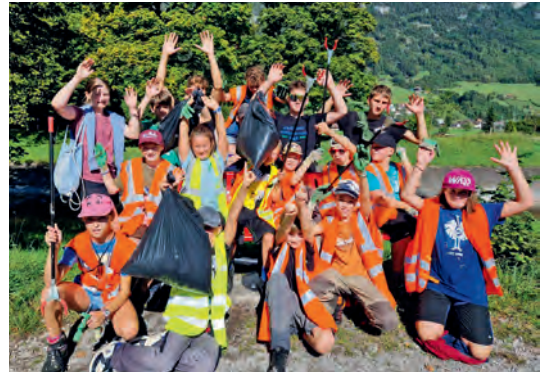
Gruppe 3 und 4 sammelten insgesamt 210 Liter Abfall

Fazit: Für die Gemeinde war es wiederum ein gelungener und unfallfreier Anlass. Dank einer guten und vorausschauenden Planung konnten alle gesetzten Ziele erreicht werden. An dieser Stelle ein grosses Dankeschön an die vielen helfenden Hände.