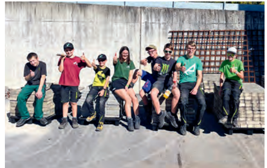
Diese Arbeit führte zu 360 kg Abfall – und trotzdem strahlende Gesichter