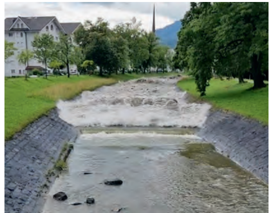
Schwallwelle in der Kleine Schliere

Bereits ein Gewitter im Einzugsgebiet der Kleinen Schliere kann innerhalb weniger Minuten gefährliche Schwallwellen auslösen, auch wenn es in Alpnach noch trocken und sonnig ist. Verlassen Sie das Gewässer bei Gewittergefahr sofort!