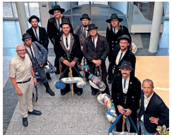
Besuch Wandergesellen im Gemeindehaus

Die Gemeindeverwaltung dankt den Wandergesellen für ihren Besuch und wünscht ihnen weiterhin eine gute und sichere Reise.