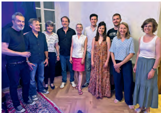
Kultur im Schlosshof