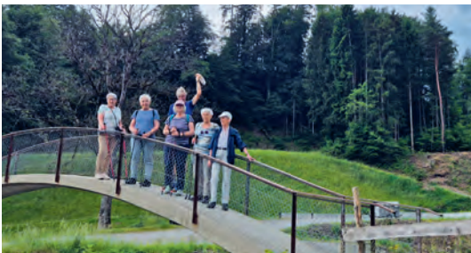
Ein beliebter Spaziergang über die Bogenbrücke, die leider dem Hochwasserschutz weichen muss.