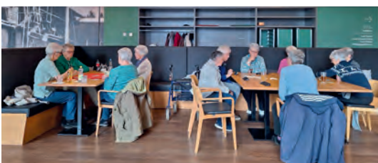
An einem der Spielnachmittage