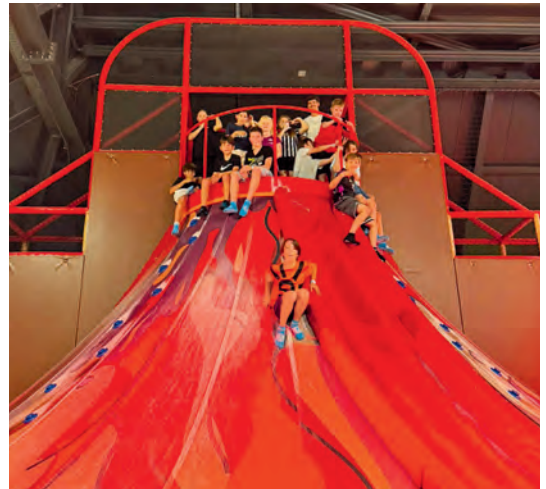
Auf der Vulkan-Kletterrutsche

Jugendliche der 6. Klasse organisierten mit Unterstützung der Jugendarbeit Alpnach einen Ausflug in den Kiddy Dome in Rohrbach. Vier engagierte Jugendliche führten Kuchenverkäufe durch, um den Preis für alle 15 Teilnehmenden zu senken. Vor Ort konnten sich die Jugendlichen auf den Trampolinen, dem riesigen Abenteuerspielplatz und vielen weiteren Attraktionen austoben.