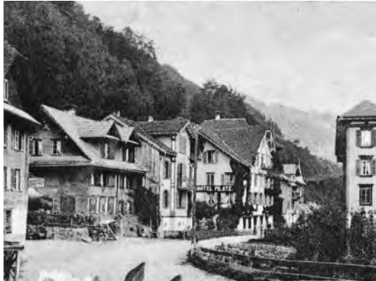
Alpnachstad mit dem «Seilerhaus» im Jahre 1907 (Bildmitte)