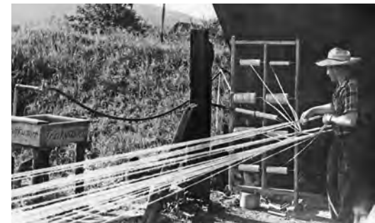
Konzentriertes Arbeiten im Werkstattgebäude am Trasse der Brünigbahn