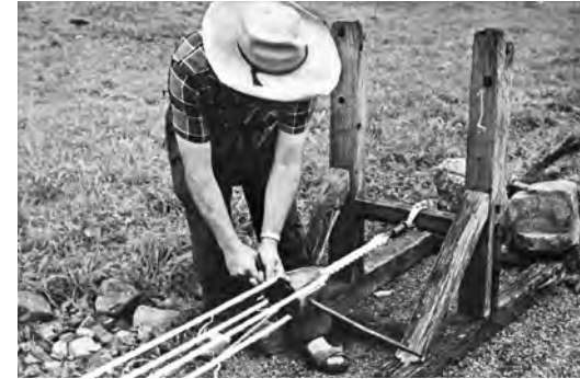
Hier entsteht von Handarbeit ein Seil durch das Zusammendrehen von 4 Litzen

wurde im Jahre 1949 mit der ersten Flechtmaschine ausgerüstet. Nach und nach erwarb die Seilerei Fischer bis gegen zwanzig Flechtmaschinen, die den Grossteil der früheren Handarbeit übernehmen. Dass sich die Seilerei Fischer über 5 Generationen halten konnte, war nur möglich durch die gute Qualität ihrer Produkte.