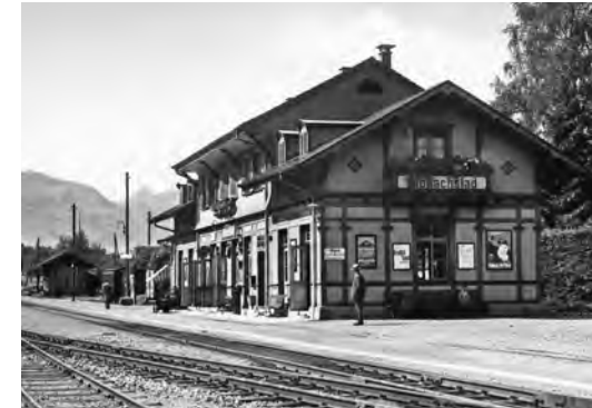
Räume im Bahnhof Alpnachstad standen jahrzehntelang als Stimm- und Wahlbüro zur Verfügung

In Schoried gab es damals verschiedene Standorte: anfänglich in der Kapelle St. Theodul, dann im Feuerwehrlokal, im ehemaligen Rosenstübli und sogar in einer fahrbaren Baubaracke gab es die Möglichkeit zur Stimmabgabe.