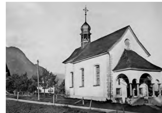
Das Urnenbüro befand sich entweder im Vorzeichen oder im Inneren der Kapelle