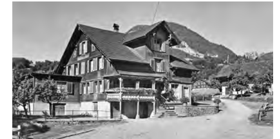
Komfortabler war das Urnenbüro im Rosenstübli, welches im ehemaligen Lebensmittelladen des Restaurants zur Verfügung stand.

Es war damals üblich, dass sich an einem Abstimmungssonntag die Männer in den Restaurants Rose und Tell zu einem Frühschoppen trafen und am Stammtisch über die aktuellen politischen Fragen diskutierten.