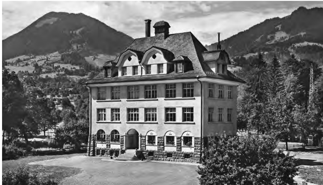
Der imposante Bau diente nicht nur als Schulhaus, sondern auch als Probelokal für Musik, Jodel, Schwingen, als Milchsuppenlokal sowie für Militäreinquartierungen

Aus aktuellem Anlass: Wahlen 2026, 110 Jahre 16er- Schulhaus