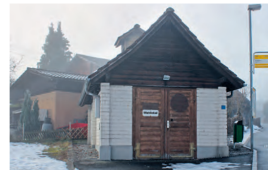
Auch das Feuerwehrlokal diente zeitweise als Abstimmungslokal