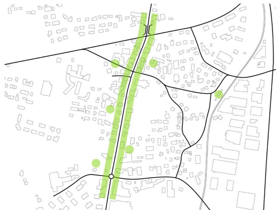
Aussenrestauration / Verkauf

Konsumnutzungen, die zeitweise öffentlichen Raum beanspruchen, sind primär an der Brünigstrasse anzusiedeln. Eine Bündelung der Aussenrestauration entlang der Brünigstrasse trägt zur Belebung des Zentrums bei und schafft Aufenthaltsqualität.